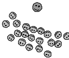
Figure 1: Organisation du contexte de classe selon une configuration type regroupement « face à face »

Cette recherche visait à étudier une leçon d'Education physique et sportive en observant son déroulement. Elle consistait à analyser le plus finement possible le cours d'action de l'enseignant et d'identifier son mode d'intervention. Dans le cours de la leçon de gymnastique, deux types d'organisation spatiale et temporelle du contexte de classe sont fréquemment repérables. Ces dispositifs d'organisation affichent une configuration différente du rapport topographique entre l'enseignant et les élèves. Un premier dispositif renvoie au format du « regroupement ». L'enseignant réunit les élèves devant lui : ce regroupement en « face à face » apparaît systématiquement dans les débuts et les fins de leçon, et apparaît aussi de façon ponctuelle et répétée en cours de leçon (Figure 1).